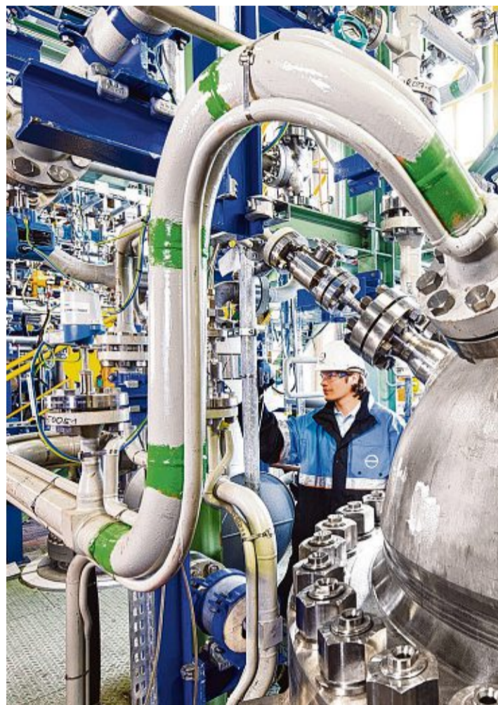
Demonstrationsanlage von Covestro in Dormagen

Die Prämisse der Innovation, die ausgezeichnet werden könnte, ist simpel: Der konventionelle Rohstoff Erdöl wird bei der Produktion von Kunststoffen teilweise durch CO 2 als Kohlen-