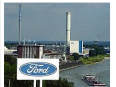
Die Ford-Werke in Niehl